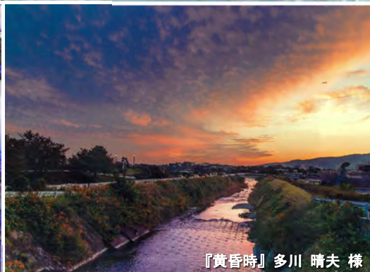
『黄昏時』多川 晴夫 様