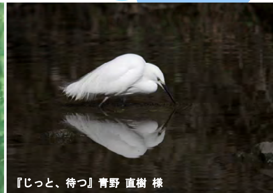
『じっと、待つ』青野 直樹 様