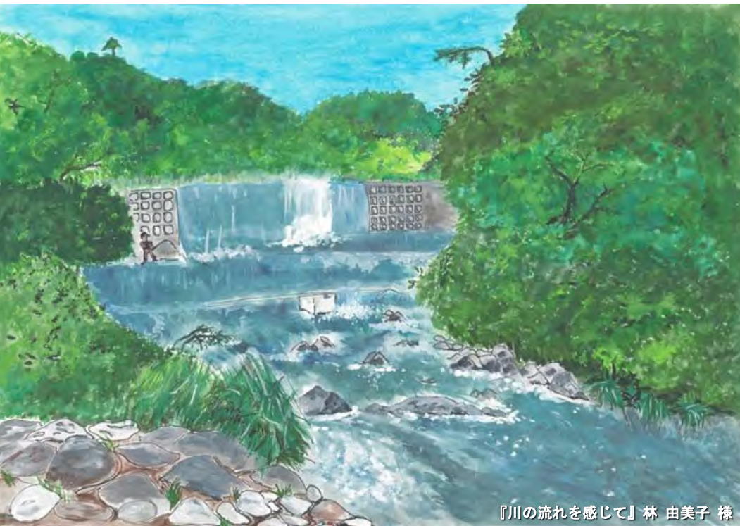
『川の流れて感じて』林 由美子 様