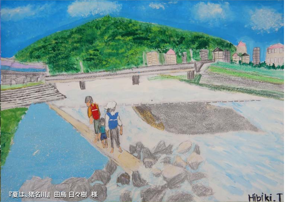
『夏は、猪名川』 田鳥 日々樹 様