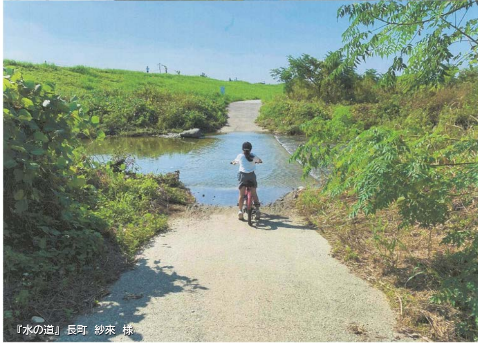
『水の道』 長町 紗來 様