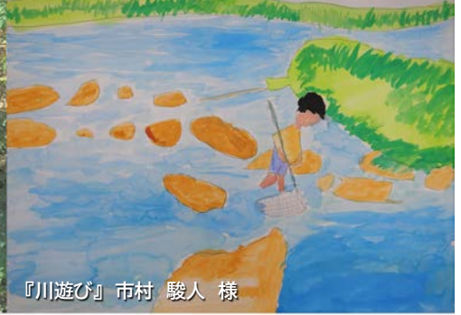
『川遊び』 市村 駿人 様