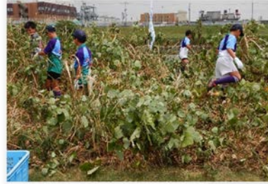
力を合わせて駆除活動！