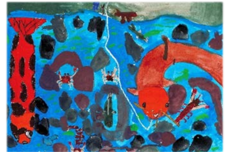
昨年の猪名川河川レンジャー賞受賞作品