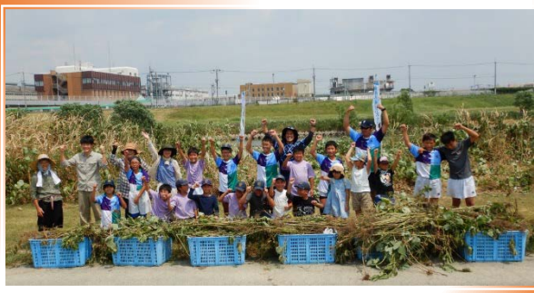
たくさん駆除できました

参加いただいた方からは、「こんなに外来種がいるのは知らなかった」「少しずつでも猪名川の環境をよくしていきたい」などの感想をいただきました。短い時間でしたが、猪名川の環境について改めて考えていただくことができました。