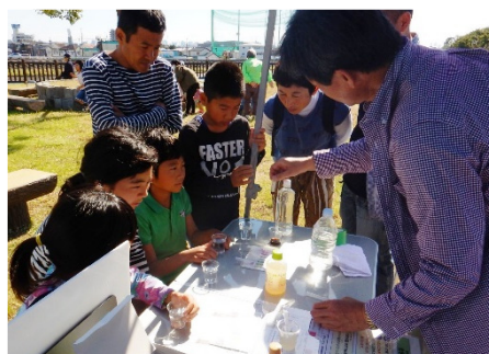
豆島フェスタでの水質パックテスト体験(10/28)