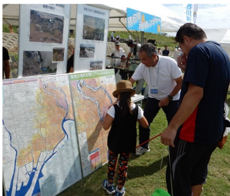
中済レンジャーがハザードマップを説明！

ハザードマップの展示にも、多くの人に立ち止まっていただきました。中済レンジャーの説明で、猪名川・藻川で水害が発生した時に自宅の場所はどのくらい浸水してしまうのか？どこに避難したら良いのか？などを考えてもらうことができました。