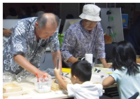
いながわ体験フェスタでの猪名川の植物を使った紙漕ぎ体験(8/25)