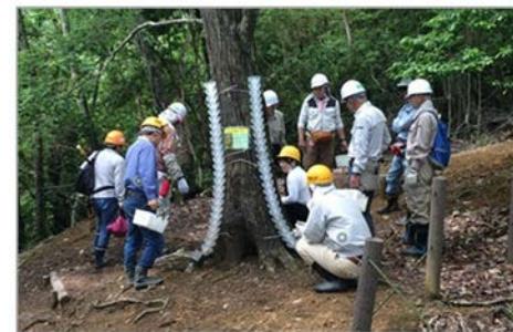
里山保全活動の様子