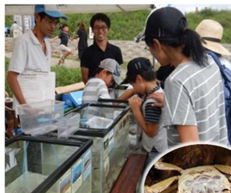
魚やカニに興味深々