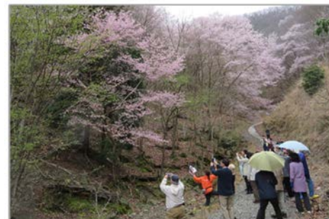
エドヒガンガイドの様子