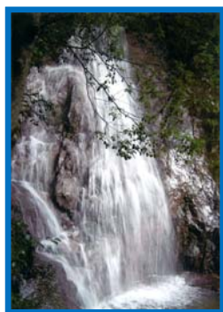
『猪名川不動瀧』(佐藤達一さん)