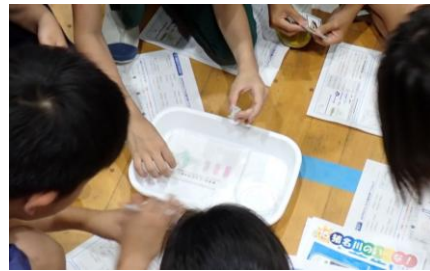
すいしつ 水質パックテスト

出前授業のまとめとして質問タイムを設けました。子どもたちからは、猪名川の 生き物について多くの質問があり、猪名川の自然環境への興味を深める様子が見られました。