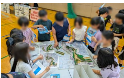
いながわ ぼうさい 猪名川の防災

こうずい とき じたく みず つ 洪水の時に、自宅が水に浸かる ふか 深さはどのくらいなんだろう?