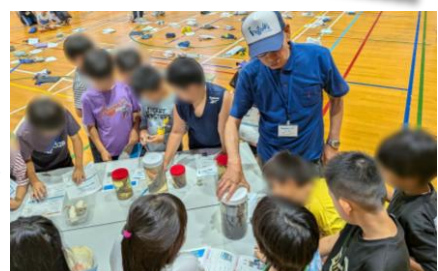
いながわ いもの ひょうほん 猪名川の生き物の標本