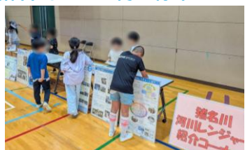
いながわかせん しょうかい 猪名川河川レンジャー紹介