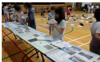
いながわ 猪名川のい〜な!