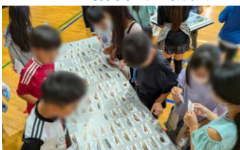
いながわ さかな 猪名川の魚