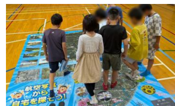
いながわ こうくうしゃしん 猪名川の航空写真