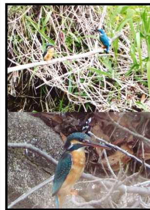
『カワセミのプロポーズ』（田中義人さん）