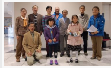
表彰式（川西市みつなかホール）の様子

今後も、より多くの方にこのイベントを知ってもらい、もっと猪名川に親しみを感じてもらえるよう、継続していきたいと思ます！