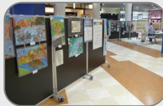
伊丹市の会場（イオンモール伊丹）での作品展開催状況

応募いただいた作品は、平成25年12月～平成26年2月にかけて、猪名川流域の6市町（猪名川町／池田市／伊丹市／豊中市／尼崎市／川西市）の会場で開催した作品展において、たくさんの方に見ていただきました！