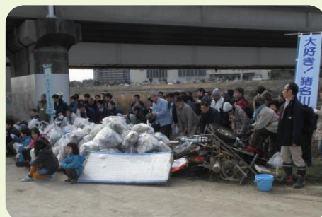
伊丹市 清掃活動後に記念撮影

それぞれの場所では、地域の人や子どもたちも参加して、たくさんのごみを集めていました。