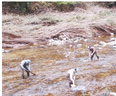
川耕しをすることで、小石の間に溜まった泥をなくします。そうすることで、魚が住みやすくなります。