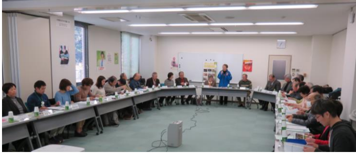
開催日時：平成27年2月21日（土） 13:30～16:50 場 所：猪名川河川事務所（池田市）

猪名川河川レンジャーの主催により、8回目となる「猪名川流域意見交換会」を開催しました。今回は、地域で活動する団体および大学サークルから24名（14団体）、「猪名川のい～な！」作品応募者4名とともに、意見交換を行いました。