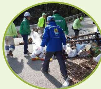
↑集めたごみを分別する様子（川西市）

2月7日に猪名川流域の6市町、計24箇所で行った清掃活動などが実施され、約1160人が参加されました。私たち河川レンジャーも参加し、みなさんと一緒にごみを拾いました。