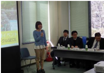
12団体が活動紹介を行いました。（写真は、大阪大学環境サークルGECSの発表の様子）

事前に団体紹介の発表を希望された12団体から日頃の活動を紹介していただきました。また、その発表内容を踏まえた上で、猪名川における“学校・地域の連携”や“情報発信”などについて意見交換を行いました。