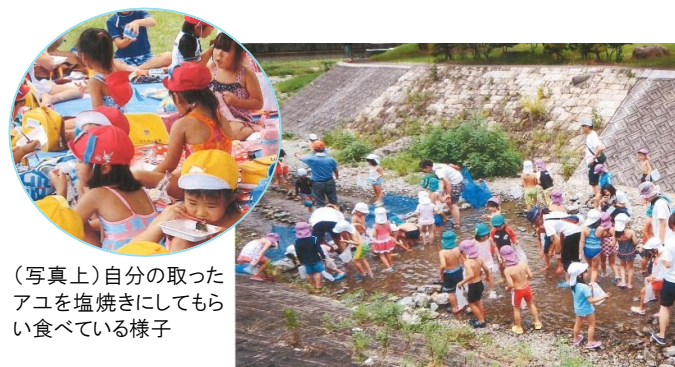
(写真上)自分の取ったアユを塩焼きにしてもらい食べている様子