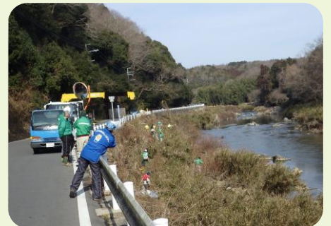
川西市 河川敷で集めたごみを道路までクレーンでひきあげている様子