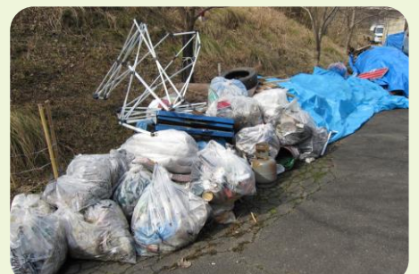
猪名川町 集めたごみ