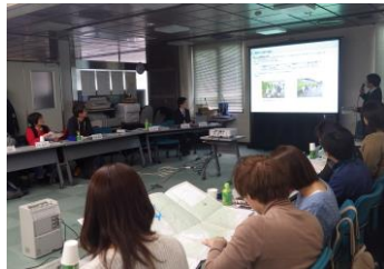
配付された地図を見ながら猪名川河川事務所の発表を聞く様子