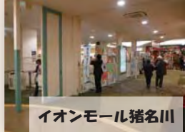
イオンモール猪名川