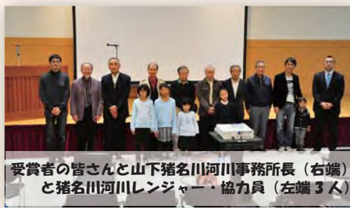
受賞者の皆さんと山下猪名川河川事務所長(右端)と猪名川河川レンジャー・協力員(左端3人)

猪名川河川レンジャーは、より多くの人に猪名川の魅力を知っていただくことと、毎年、猪名川流域の様々な魅力を表現した写真・絵画を募集し、応募作品の展示を行っています。第5回目となる今年度の「猪名川のい〜な!」では、総勢76名の皆様から「大スキ いな川」をテーマにしたとても素敵な作品をご応募いただきました。