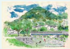
「猪名川風景」 おおと やすとよ 大音 泰豊さま