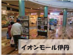
イオンモール伊丹