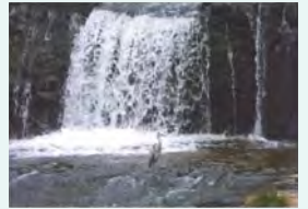
「景勝地「屏風岩」にて」 なかむら まさのり 中村 正剛さま