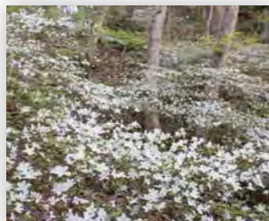
シロバナウンゼンツツジの群落

そこで、清和台団地の皆さんや清和台自治会の協力をいただき、虫生の森の手入れをしようと活動を開始しました。