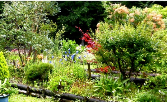
園芸グループが管理する色鮮やかなガーデン