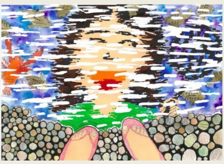
昨年の猪名川河川事務所賞 受賞作品