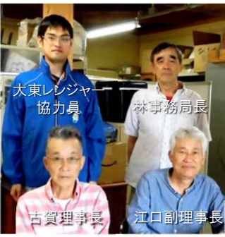
大東レンジャー協力員ととどろみの森クラブの皆様

一般の方が参加できるイベントとしては、飯盒炊飯、農作物収穫、森林散策、木工体験などを年に数回開催しています。また、地元の小学校の体験学習や講座も担当しています。