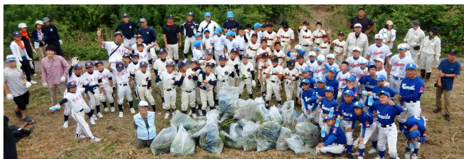
子供たちと河川レンジャー みんなで記念撮影

野球チームの皆さんのパワーに力強い手ごたえを感じました。川によく来られる人が河川敷の草むらに入り外来種繁茂の現状について学び、共に汗を流す駆除体験をして頂いたことは一歩前進だと思ひます。若い人達に伝えられて嬉しかったです。