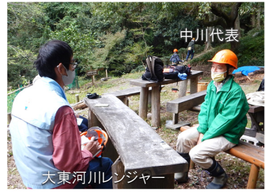
インタビューの様子 (五月山 すがたに広場にて)