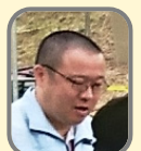
原口河川レンジャー