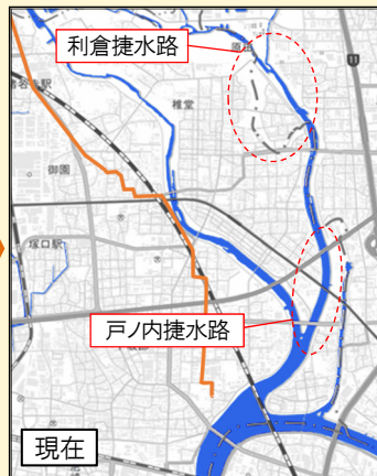
猪名川下流部の河道(左:明治期、右:現在)と有馬道(オレンジ色線) ※地理院地図( https://maps.gsi.go.jp/ )を加工し、現況河道、旧河道、有馬道を重ねて作成。