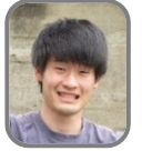
水谷河川レンジャー

水谷河川レンジャーより一言 子どもたちの好奇心旺盛さに助けられ、楽しく進行することができました。最後には、猪名川の生き物を紹介して大歓声をいただきました。生き物は心を掴める力を持つと改めて感じます。