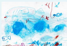
『さかながないてる』 今北 菜々美様