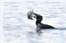
『甦る水面』 西 誠生様