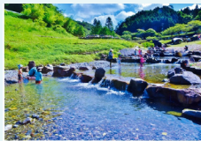
『清流黒川』 結城 正旨様