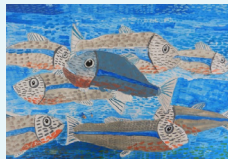
『キレイな色だね』 中村 健吾様