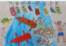
『猪名川タイムスリップ』 大東 美輝様