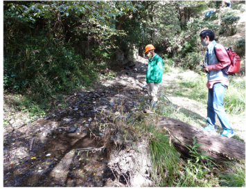
杉ヶ谷川の様子 まわりの草や木を刈り取り、子供が安心して遊べる空間になっている

猪名川は五月山と繋がっています。山が良い状態でなければ、下流の川の環境も乱れてしまいます。私たちの活動が、猪名川流域全体の山や川の保全に繋がると思っています。ぜひ、山にも関心を持って、足を運んでください。