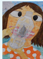
『ペットボトル水族館』 重場 優歩様