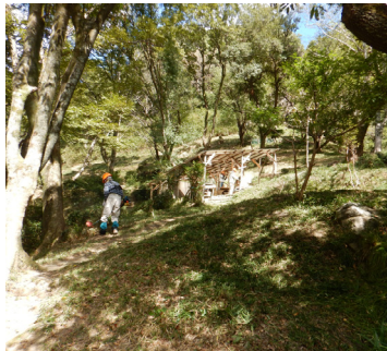
開けて明るい里山の風景は 毎月の保全活動の成果