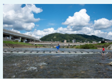
『架け橋』 西島 陽公様