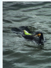
『人間の犠牲』 豊島 輝満様