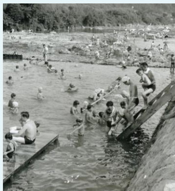
1958年(昭和33年)の鶯の森遊泳場

同日、駅前に猪名川の「小戸井堰(おおべいせき)」を利用した鶯の森遊泳場が開設されました。貸しボート・脱衣所・ヨシズ張りの休憩所・売店なども多く造られ、大いに賑わっていました。残念ながら、昭和34年(1959年)9月、伊勢湾台風により施設が流失し、閉場されました。この頃は、猪名川が日常的に天然プールとなり、水泳や水遊び、学校の水泳授業にと人々に親しまれていました。