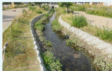
キセラ川西せせらぎ公園の水路

小戸井堰とは、小戸村を含む8ヶ村(川西市内)への農業用水を引くために整備された井堰です。引水地点から各村々への用水路を小戸井(おおべゆ)と呼びます。慶安3年(1650年)にはじめて定堰がつけられました。水田の拡充につれて用水が不足するようになり、元禄7年(1694年)に、猪名川の両岸を結ぶ定堰が設けられました。全面定堰化により木材流しが厳しい状況にあったことが想像されます。現在では、水田の減少に伴う住宅地の拡大等々によりほとんどが暗渠になっていますが、川西北小学校東側、キセラ川西せせらぎ公園などでは猪名川の分流とも言える水の流れを見ることが出来ます。 (文:今西 元河川レンジャー協力員)