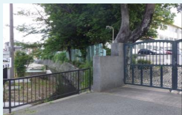
川西北小学校東側(正門付近)の水路