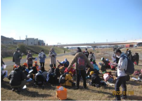
池田自然観察会の様子

一番の課題はメンバーの高齢化です。今までやってきた思いを継いでくれる新しい世代、バトンを渡していける若い人がいないのが一番のネックです。また、自然観察会の内容が繰り返しになっているため、工夫が必要だと感じています。