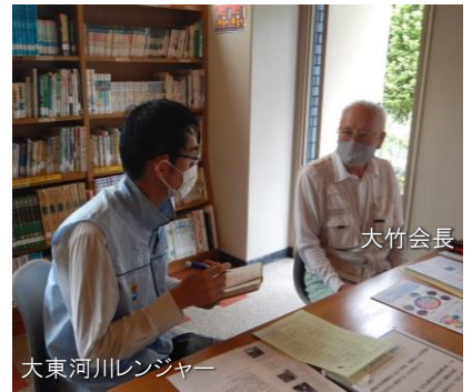
大東河川レンジャー インタビューの様子