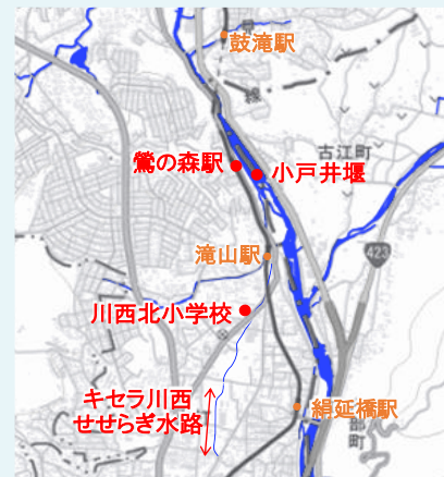
※地理院地図(https://maps.gsi.go.jp/)の色調を加工し、現況河道や地点名などを重ねて作成。

小戸井堰とは、小戸村を含む8ヶ村(川西市内)への農業用水を引くために整備された井堰です。引水地点から各村々への用水路を小戸井(おおべゆ)と呼びます。慶安3年(1650年)にはじめて定堰がつけられました。水田の拡充につれて用水が不足するようになり、元禄7年(1694年)に、猪名川の両岸を結ぶ定堰が設けられました。全面定堰化により木材流しが厳しい状況にあったことが想像されます。現在では、水田の減少に伴う住宅地の拡大等々によりほとんどが暗渠になっていますが、川西北小学校東側、キセラ川西せせらぎ公園などでは猪名川の分流とも言える水の流れを見ることが出来ます。 (文:今西 元河川レンジャー協力員)