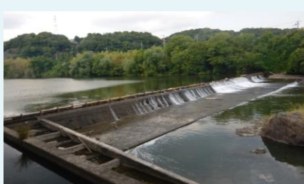
小戸井堰・小戸井