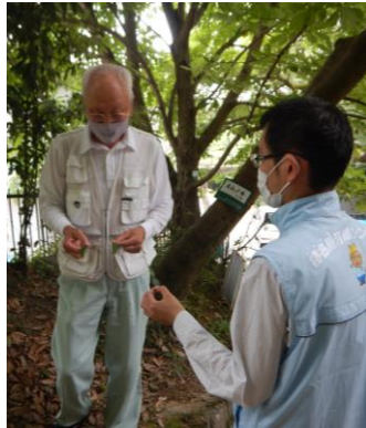
五月山の散策路沿い

五月山や猪名川など、身近に素晴らしい自然があります。皆さんにこの良さをもっと知ってもらいたいと思います。まずは、五月山や猪名川に足を運んでください。ぜひ『池田自然観察会』にもご参加ください。