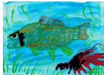
『猪名川と生き物』 鶴本 晴土 様