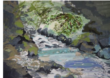
『竜』 大川 祐楠 様