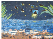
『ホテルを見上げたら』 勝川 絵葉 様