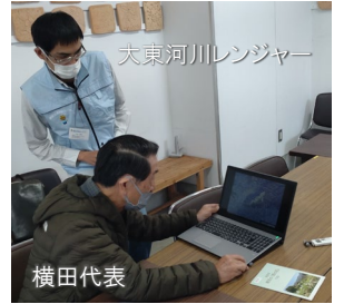
インタビューの様子 (細河コミュニティプラザ「緑の郷」)