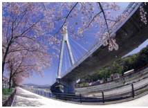
『桜 降るころ』 前川 敏夫 様