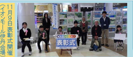
11月9日表彰式開催 (イオンモール伊丹会場)