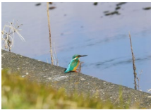
『何、見てる!!』 福井 照明 様