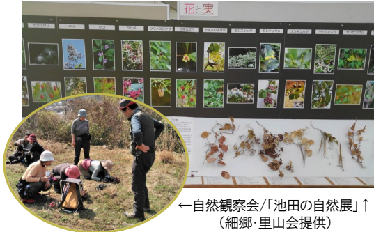
←自然観察会/「池田の自然展」↑

細河地区の里山の自然を守るためには、お金をかけて個々の環境を保全するのではなく、植木産業などの地域の営みの発展があつての自然環境なので地域全体の自然環境が将来に受け継がれていくことが重要です。細河地区の自然環境を紹介すると「こんな自然があつたのか」と驚かれる声も多くあります。まずはこうした地域の自然の良さを広く知ってもらうことが、細河地区の自然を守る第一歩であると考え活動に取り組んでいます。但し、会のメンバーの高齢化も進み、こうした思いを次の世代に繋いでいくことが課題となつています。