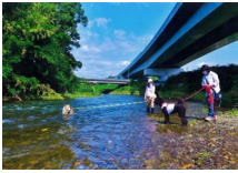
『夏の川』 結城 正旨 様