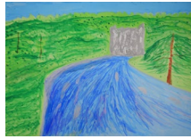
『屏風岩と猪名川』 木原 遥貴 様