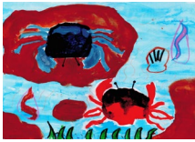
『川の生き物あつまれ!』 森本 真穂 様