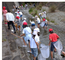
水生生物の捕獲・観察