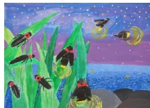
『ホタルと星たち』 坂下 然音様