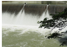
『大雨の後の放水路』 山本 平男様