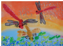
『トンボだっ!!』 勝川 仁菜様