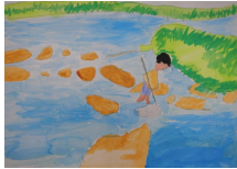
『川遊び』 市村 駿人様