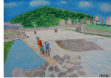
『夏は、猪名川』 田島 日々樹様