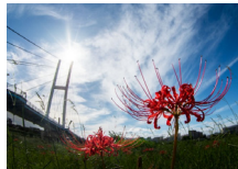
『秋を感じる』 薄井 研司様