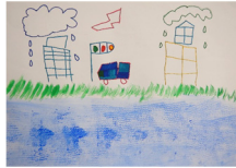
『川のあるまち』 田中 梨瑚様