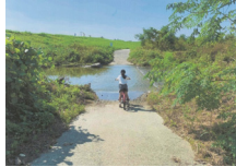
『水の道』 長町 紗來様