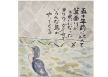
『箕面川に鳥がやってきた』 村本 明様