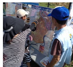
ハザードマップの体験展示