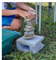
石ころチャレンジ

また、小さな子供でも楽しく遊びながら猪名川への興味が深まるように、ゲーム感覚の「石ころチャレンジ」を行い、猪名川の河原にある様々な石の中から同じ重さの石を探したり、石を高く積み上げたりして、猪名川の自然に親しんでもらいました。小さな子供からお父さんまで、多くの方が真剣な眼差しで挑戦していました。