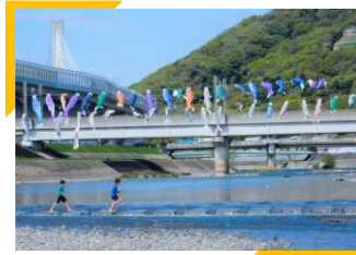
『猪名川を泳ぐ』(匿名)