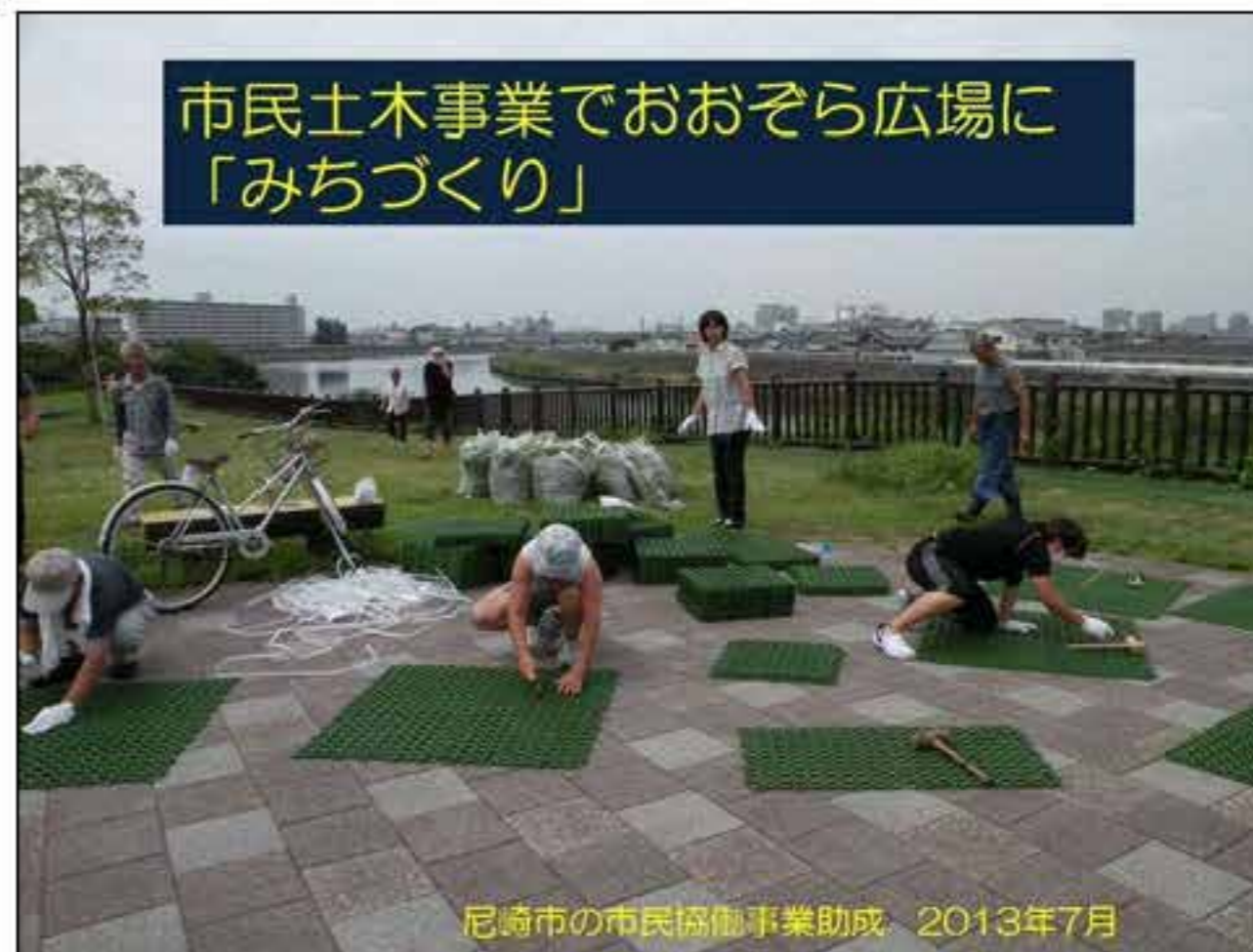
市民土木事業でおおぞら広場に 「みちづくり」