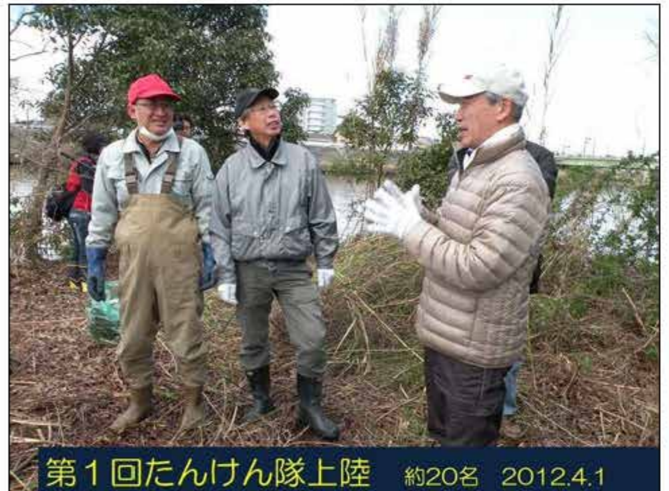
第1回たんけん隊上陸 約20名 2012.4.1