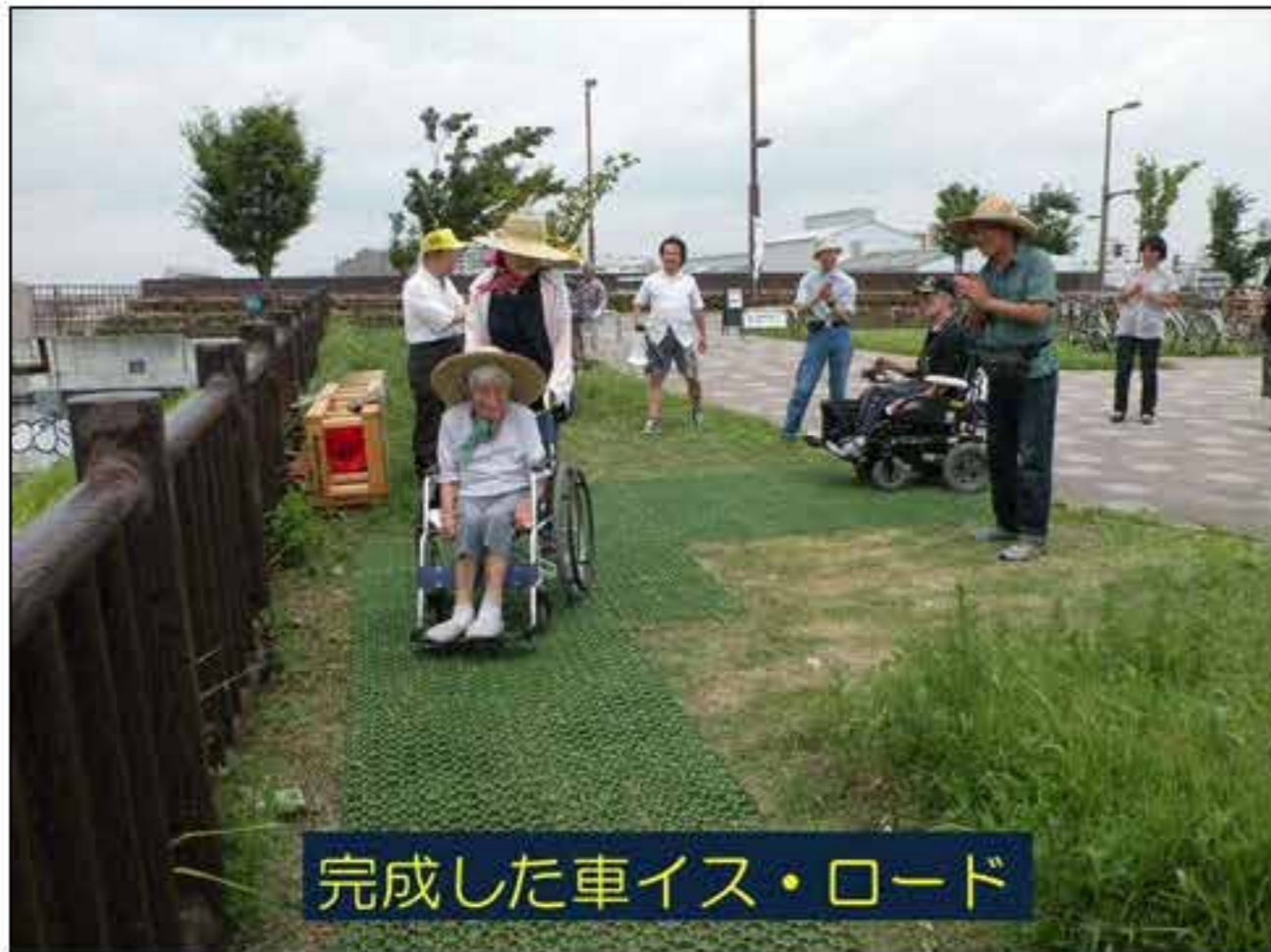
完成した車イス・ロード