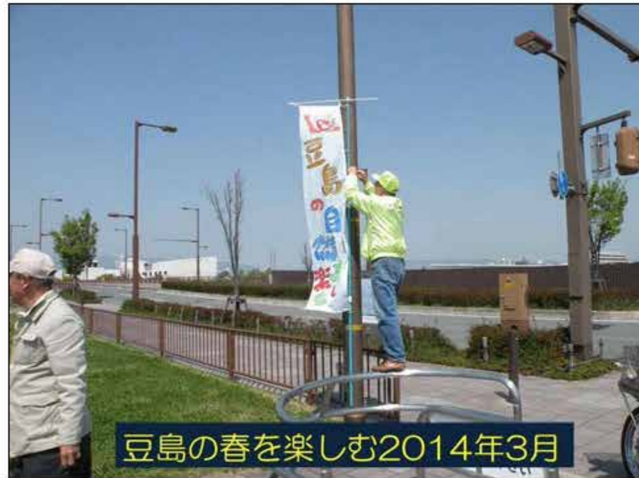
豆島の春を楽しむ2014年3月