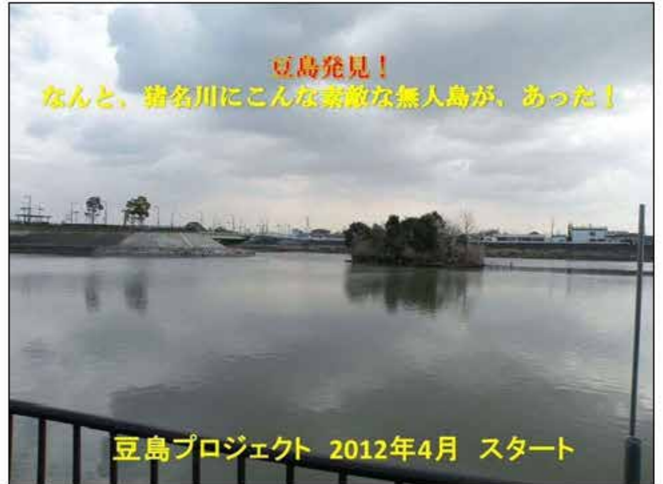
豆島プロジェクト 2012年4月 スタート