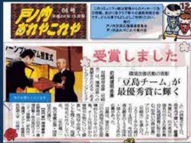
あましんグリーンプレミアム受賞