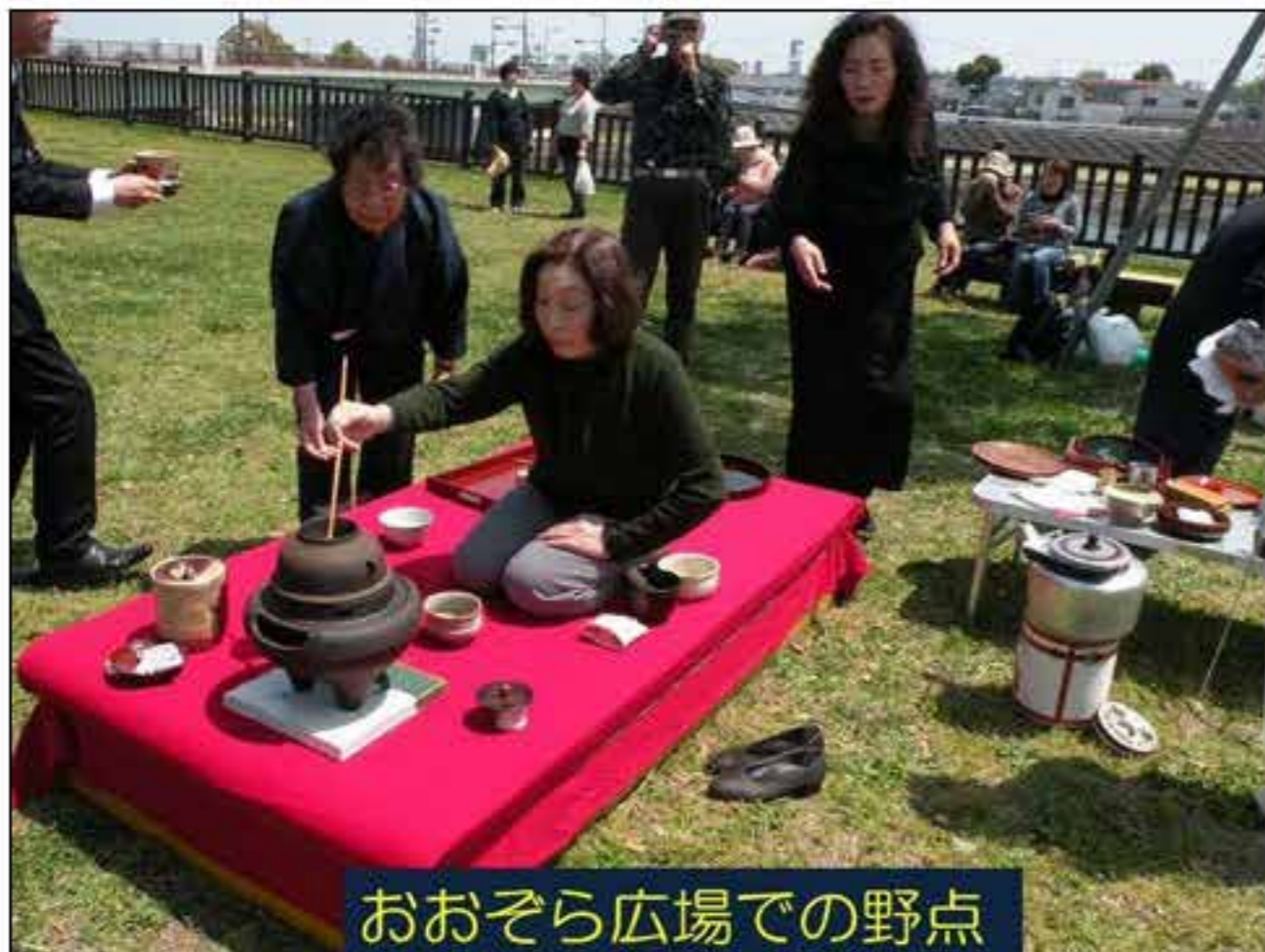
おおぞら広場での野点