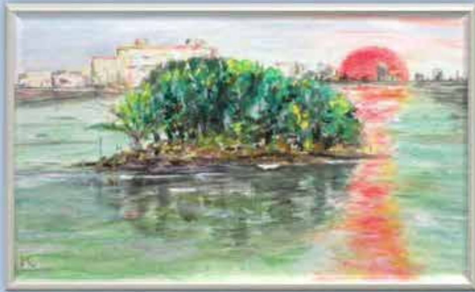
あおぞら広場からの豆島夕照之景尼崎市内随一の景勝地 ?! 豆島プロジェクトチーム

猪名川・藻川合流点にある「豆島」からの環境再生プロジェクト 猪名川流域意見交換会報告資料 2015.2.21