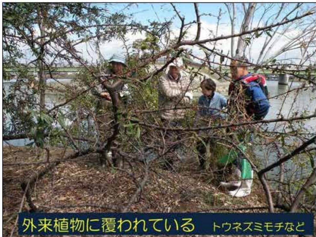
外来植物に覆われている トウネズミモチなど