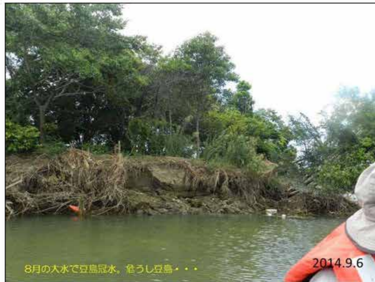
8月の大水で豆島冠水。危うし豆島・・・