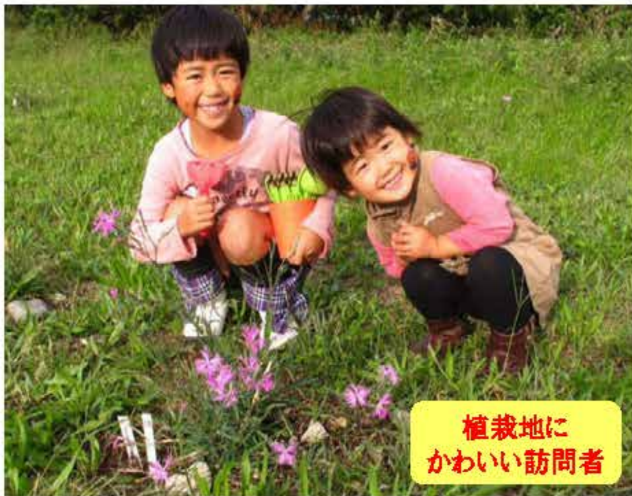
植栽地に かわいい訪問者