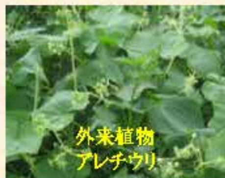
外来植物 アレチウリ