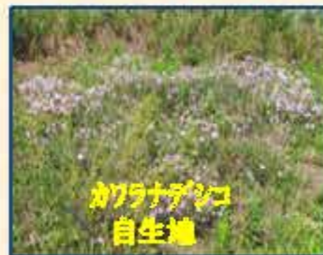
カワラナデシコ 自生地