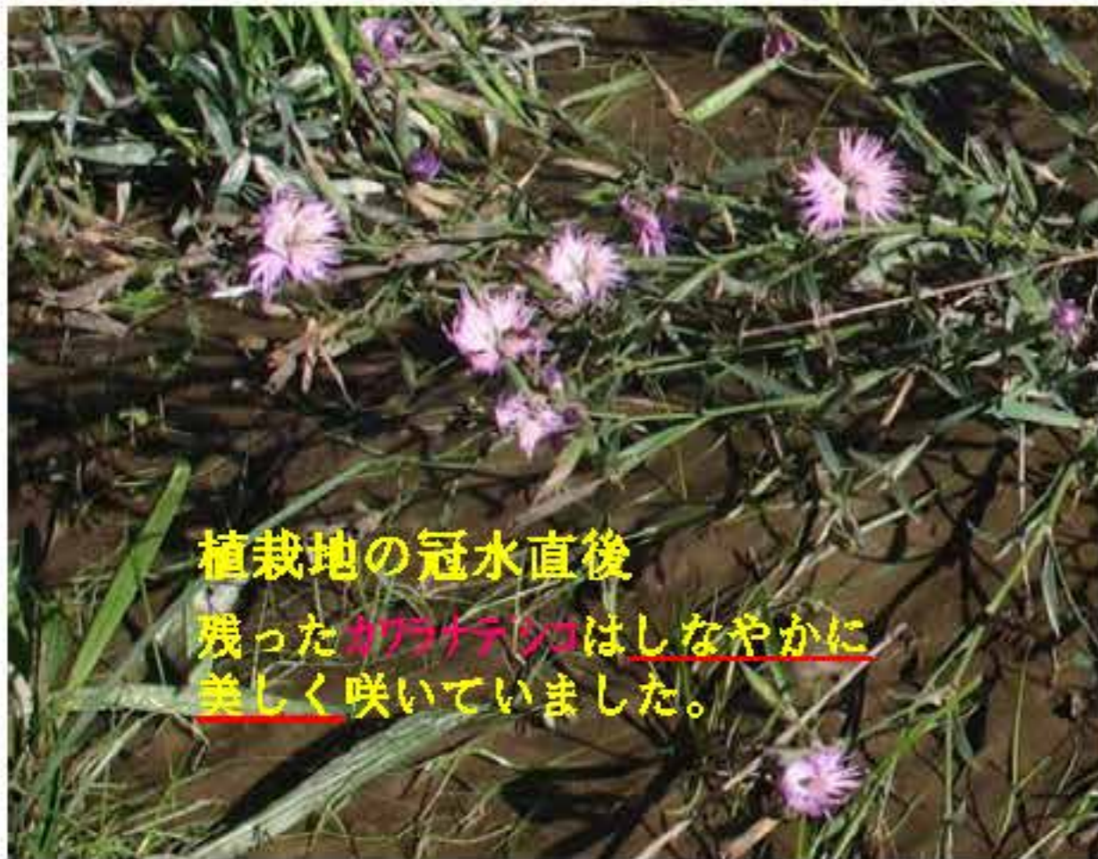
植栽地の冠水直後 残ったナadeshikoはしなやかに 美しく咲いていました。