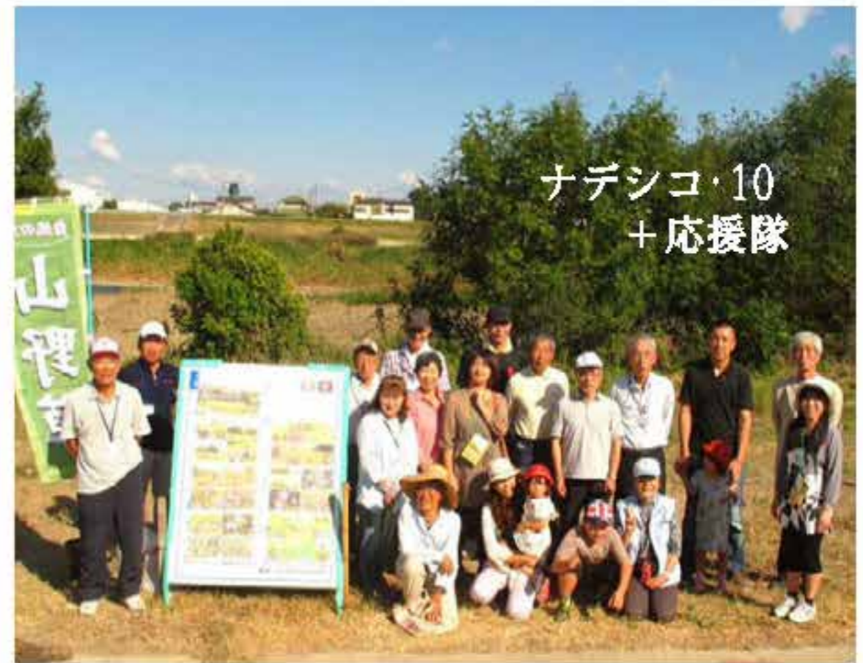
ナadeshiko・10 + 応援隊